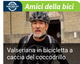
Valserriana in bicicletta a caccia del cocodrillo